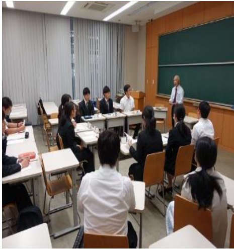
研修A：集団討議で指導を受ける受講者