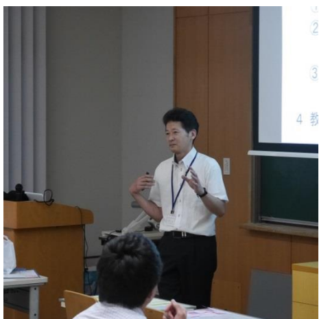
研修1：高校部会の様子

参加者からは、「目の前の子どもたちのために学んだことを生かしていきたいです」、「学級経営や試験のことなど多くのことを学べ、大変有意義な時間を過ごせました」、「すべての研修で月曜日からすぐに生かせるお話ばかりでとても参考になりました」など前向きな評価を多くの方からいただきました。