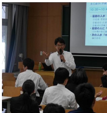
研修2：中学校部会の様子